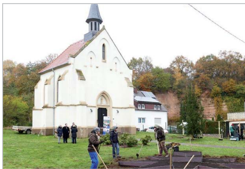
ArbeiterInnen und gärtnerische Fachkräfte bei der Arbeit

und Beruf Saar“ in Saarbrücken und in Unterstützung durch das INTERREG Büro im Ministerium für Wirtschaft des Saarlandes. Die Einsatzkräfte an den beiden Tagen sind Arbeiterinnen und Arbeiter und gärtnerische Fachkräfte der fünf KreaVert-Projektpartner in der Großregion. Die Arbeiter sind langzeitarbeitslose Frauen und Männer, die über die jeweiligen regionalen Arbeitsverwaltungen, unter ihnen das Jobcenter Saarbrücken, in das Projekt zugewiesen werden. Lokale Partner und Akteure sind die Stadt Völklingen, der Ortsrat Ludweiler und die Patengemeinschaft Wendalinuskapelle. Der fertig gestaltete Garten wird gemeinsam von den Projektpartnern im Rahmen des Warnd-Weekends im Sommer 2020 der Öffentlichkeit vorgestellt.